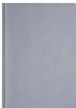
Rysunek 2. Układ tygodniowy